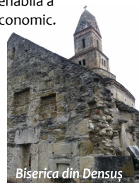
Biserica din Densuș